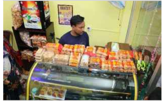
La nuova caffetteria

Gli studenti della Scuola Centrale Rishilpi hanno ottenuto ottimi risultati agli esami per il conseguimento del diploma di scuola secondaria (SSC)