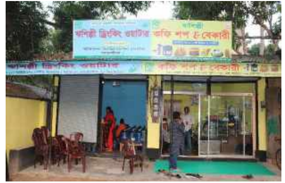
La nuova caffetteria

Il 24 novembre, Rishilpi ha inaugurato il "Rishilpi Coffee Shop and Bakery" ad Amtala, Satkhira, dove i consumatori troveranno i loro prodotti da forno preferiti. All'inaugurazione erano presenti il direttore e il rettore di Rishilpi, alcuni ospiti italiani, il personale di diverse sezioni e alcune personalità di Satkhira. Lo staff del progetto di trattamento delle acque (WTP) ha organizzato una cerimonia di taglio della torta e ha distribuito dolci agli ospiti presenti. Gli abitanti della zona sono rimasti molto soddisfatti e hanno ringraziato Rishilpi per l'apertura della caffetteria e della panetteria che consentirà loro di avere prodotti freschi.