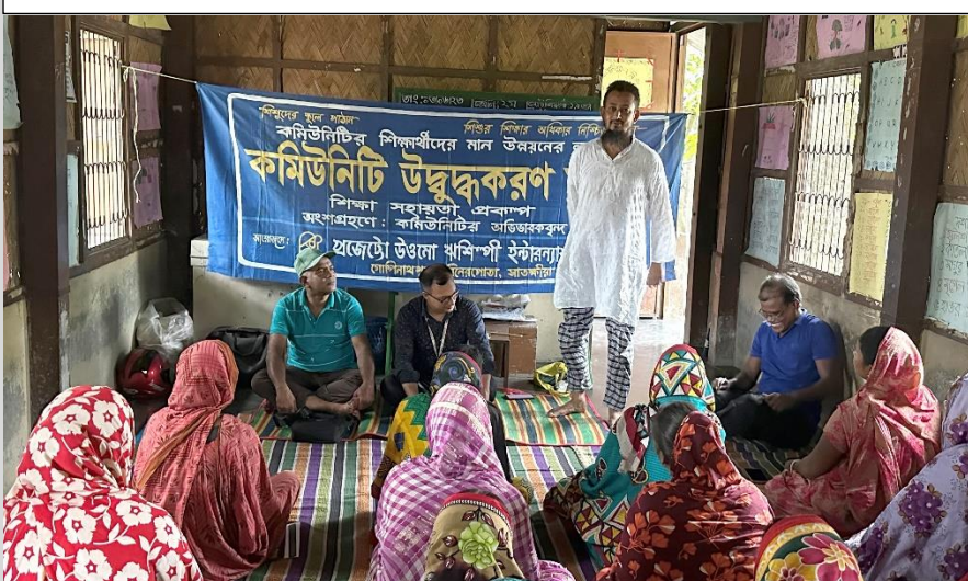
Community mobilization at Rishilpi community primary school