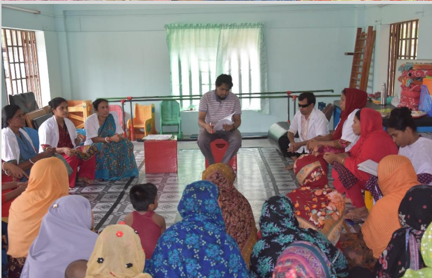
Counseling meeting held at Physiotherapy unit